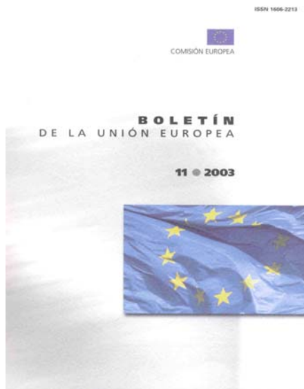
Boletín de la Unión Europea No. 11, 2003.

En Internet consulta los textos completos