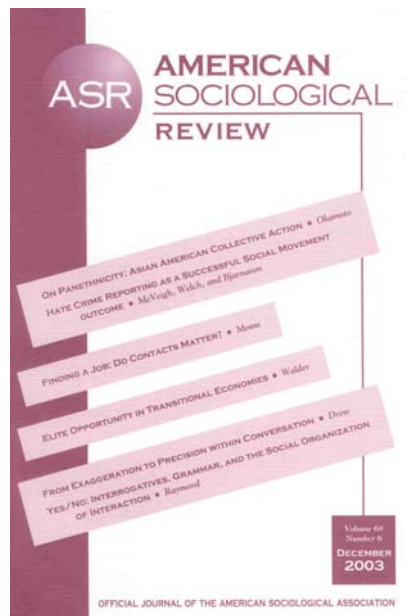
American Sociological Review Vol. 68, No. 6 2003.

http://europa.eu.int/abc/doc/off/bulle/s/200312/sommaio0.htm