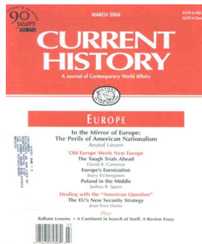
Current History March 2004

En la primera parte del trabajo se presentan brevemente algunas características generales del conjunto de la población las cuales sirven de marco para avanzar en el estudio de las trabajadoras. Asimismo, en líneas generales esta información permite evaluar la evolución del empleo femenino al compararla por un lado con los datos de una parte del censo de Revillagigedo y por el otro al confrontarla con otras fuentes o testimonios del periodo.